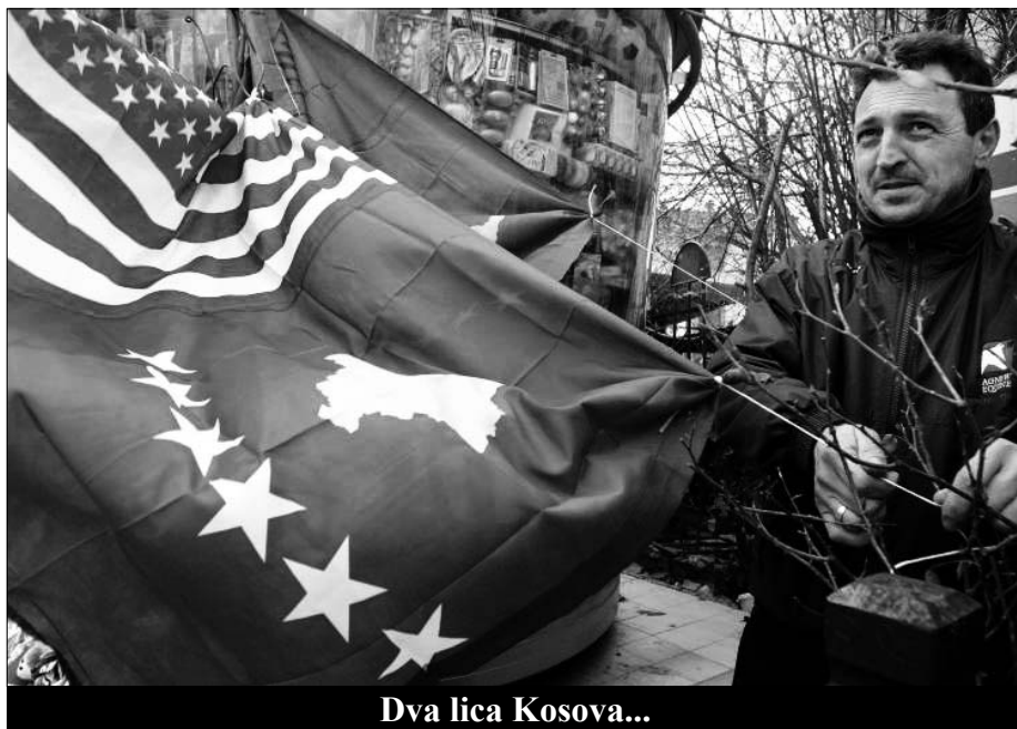
Dva lica Kosova...

Ali proglašenje nezavisnosti proračunato je i kao potpora vladi Kosova. 1999. SAD su poverile vladavinu