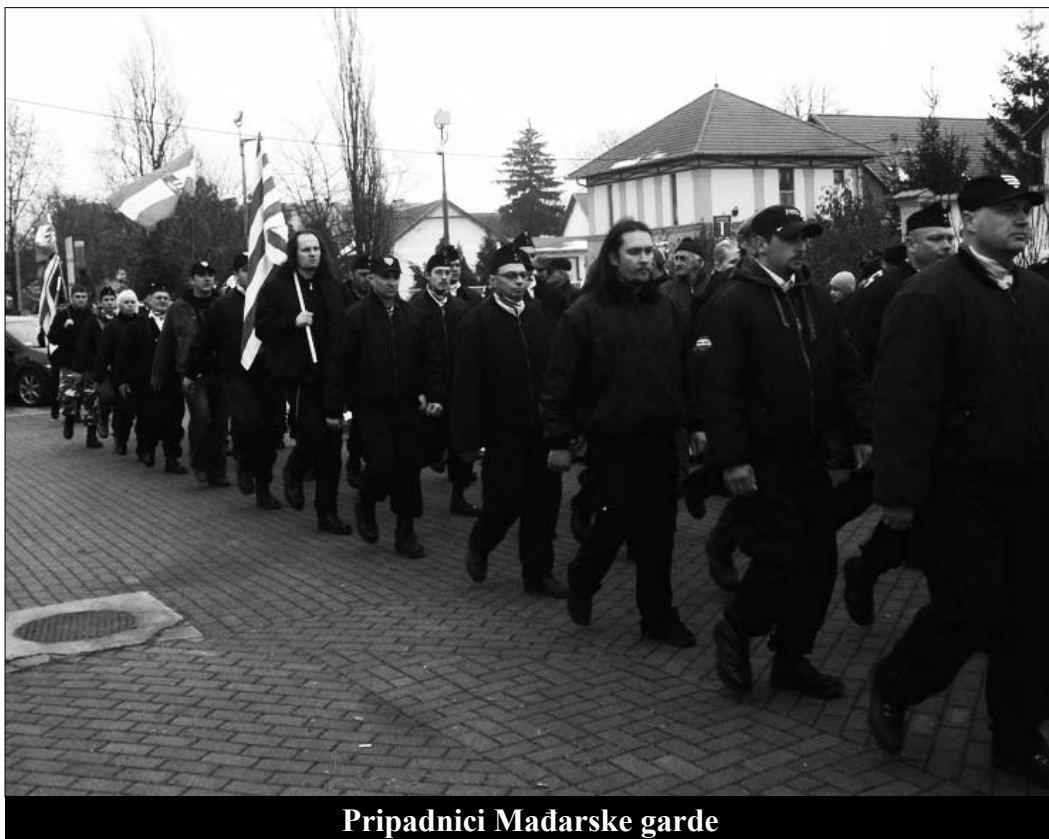
Pripadnici Mađarske garde

Vlada je popustila i šef policije je iste večeri bio vraćen na položaj. Desničarske novine i magazini su kao glavne vesti objavili: “Istina je pobedila”, “Romi su kriminalci: Zvanično”.